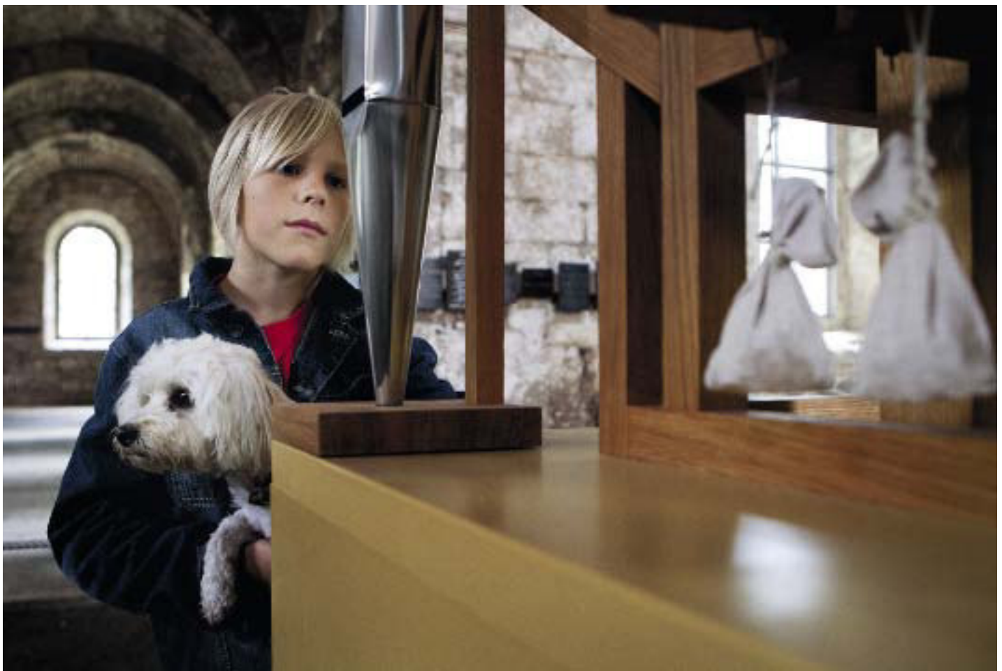
Små sandsække holder orgelpiberne åbne og erstatter dermed organistens hænder, der nok ville blive trætte ad åre.